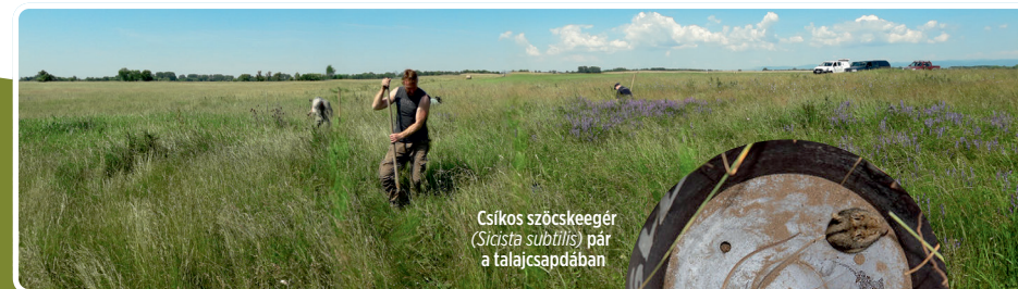
Csíkos szöcskeegér ( Sicista subtilis ) pár a talajcsapdában