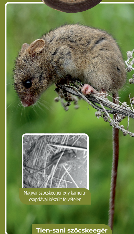
Magyar szöcskeegér egy kameracsapdával készült felvételen

Az utóbbi években kamerák is figyelik a szöcskeegerek mindennapjait. A felvételek alapján a szöcskeegerek viszonylag későn, Húsvét környékén kezdik éves aktivitásukat, addig október végén kezdődő téli álmukat alusszák.